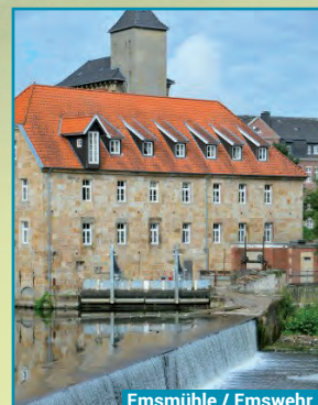
Emsmühle / Emswehr

1754 ließ der Bischof von Münster, Clemens August I. von Bayern, einen Neubau der Mühle mit drei Wasserrädern zwischen der Mühle und dem Wehr, errichten. Nach einem Brand im Jahre 1894 wurde die Mühle um ein Stockwerk erhöht und die Wasserräder gegen Turbinen ausgetauscht. 1937 ergänzte man die Mühle mit einer Siloanlage, die das Bildnis eines Sämanns ziert. Aus wirtschaftlichen Gründen wurde die Mühle zum 31.12.1965 stillgelegt. Seit 1985 dient sie wieder zur Erzeugung von Strom. Sie produziert jährlich mit zwei Turbinen 900.000 kWh Strom.