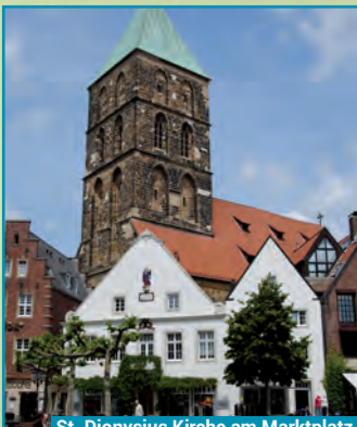
St. Dionysius Kirche am Marktplatz

In der Nachfolge einer bereits 838 erwähnten Kirche entstand ab 1400 in mehreren Bauabschnitten die kath. Hallenkirche. St. Dionysius ist damit das älteste Bauwerk der Stadt. In dem unregelmäßigen Querschnitt spiegelt sich die lange Baugeschichte wieder, deren Fertigstellung mit dem Guss der ältesten Glocke Rheines 1520 beendet wurde. Auf dem Türsturz stehen drei Figuren, der Bischof von Paris Dionysius (als Pfarrpatron), sein Diakon Eleutherius und sein Priester Rusticus. Alle drei wurden 285 auf dem Montmartre (= Berg der Märtyrer) hingerichtet.