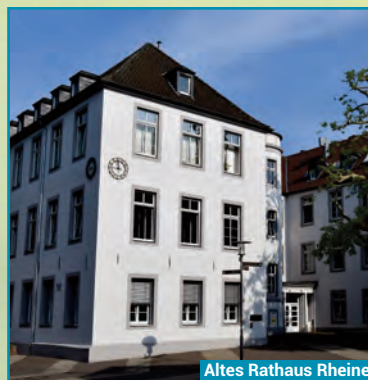
Altes Rathaus Rheine

Rheine verdankt seine Geburt einem Kalkhügel, der den fränkischen Krieger vor rund 1.200 Jahren ins Auge stach, prächtig geeignet, darauf einen Stützpunkt zu errichten, um so die wichtige Furt in der Ems zu sichern. Wo heute der Falkenhof steht, war früher die „villa vocata Reni“. Und genau unter diesem Namen hat Rheine seinen ersten geschichtlichen Auftritt. In der Schenkungsurkunde vom 7. Juni 838, mit der Kaiser Ludwig der Fromme, das auf dem bereits erwähnten Kalkhügel gelegene Gut „Reni“ den Benediktinerinnen des Stiftes Herford vermachte. Ludwig II, Bischof von Münster, verlieh den Rheinensern am 15. August 1327 das Stadtrecht. Im Zeitalter der Industrialisierung um 1850, blühte die kleine Ackerbürgerstadt auf. Die Stadt wuchs durch die Textilindustrie und den Ausbau der Eisenbahn. Mit ca 80.000 Einwohnern und guten Perspektiven für die Zukunft – so präsentiert sich die Stadt heute. Ob zum Wohnen, Lernen, Arbeiten oder Erleben: Rheine bietet auf 146 Quadratkilometern ein attraktives Leben an der Ems.