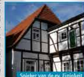
Spieker van de ev. Einigkeit

Het twee verdiepingen hoge vakwerkhuis uit de 18e eeuw is het enige behouden gebleven pakhuis van de oude stad. Oorspronkelijk had het een puntdak en was vanwege brandgevaar afgescheiden van het woonhuis. Een luik in de vloer en een soort hijskraan maken duidelijk dat de bovenste verdieping als "Spieker", oftewel als graanopslag werd gebruikt. Het vakwerkhuis hoorde dus bij een stadsboerderij.