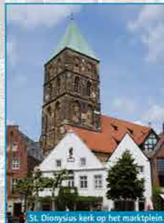
St. Dionysius kerk op het marktplein

De katholieke hallenkerk werd vanaf 1400 in meerdere fases gebouwd ter vervanging van een al in 838 beschreven kerk. St. Dionysius is aldus het oudste bouwwerk van de stad. In de onregelmatige doorsnede is de lange bouwperiode te zien. Met het gieten van de oudste klok van Rheine was de kerk eindelijk in 1520 af. Boven de hoofdingang staan drie figuren, de bisschop van Parijs Dionysius (als beschermheer van de parochie), zijn diaken Eleutherus en zijn priester Rusticus. Alledrie zijn ze in het jaar 285 op Montmartre (= berg van de martelaren) terechtgesteld.