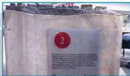
De in de stadsgids beschreven bezienswaardigheden zijn voorzien van dergelijke borden