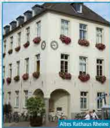
Altes Rathaus Rheine

Aan de nu open binnenplaats lag van 1660 tot 1822 de lange smalle kloosterkerk van de orde van de Franciscanen die sinds 1635 in Rheine gevestigd waren. Het in 1662 gebouwde huis met drie vleugels, werd eerst als klooster en vanaf 1811 ook als school gebruikt. Later kreeg het nog een functie als rechtbank en vanaf 1910 werd het stadsbestuur er ondergebracht. De traptoren en de bovenverdieping werden er in 1887 en 1938 aan toegevoegd.