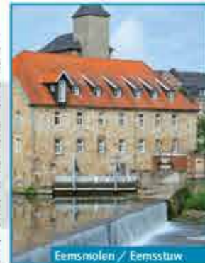
Eemsmolen / Eemsstuw

In 1754 liet de bisschop van Münster, Clemens August I von Bayern, een nieuwe molen bouwen met drie waterraderen tussen de molen en de stuw. Na een brand in 1894 werd er op de molen nog een verdieping gebouwd en werden de waterraderen door turbines vervangen. In 1937 bouwde men bij de molen een silo waarop een zaaierende man staat afgebeeld. Om economische redenen werd de molen op 31 december 1965 stilgezet. De molen wordt sinds 1985 weer gebruikt om stroom op te wekken en produceert met twee turbines 900.000 kWh stroom per jaar.